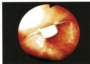
◀ 食道にななめに突き刺さった包装シート(内視鏡写真)

包装シートが、食道や胃などに突き刺さって、穴をあけるなど、重大な傷害を招くことがあることをご存じですか。