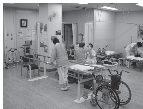
図3 実際のリハビリテーション

は、回復的、維持的リハビリテーションが中心となり、機能の回復や維持訓練、廃用症候群改善が主目的となる。実際のリハビリテーション内容としては、立位歩行練習、離床訓練、移乗動作、心理的サポートを含めた作業活動、言語聴覚士による摂食嚥下治療、頭頸部術後の発声訓練などである(図3)。緩和的リハビリテーションは、終末期のがん患者が対象となり、トータルケア病棟にも該当者が入院しているが現時点では実施していない。