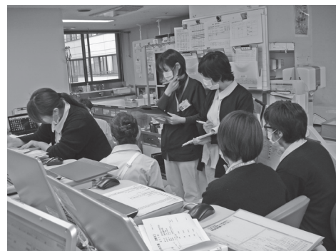
図1 多職種とのカンファランス

また、トータルケア病棟の患者の主治医や看護師、地域連携室とのカンファレンスへの参加も重要な業務である。専従理学療法士・専従作業療法士は、退院支援に関わるカンファレンスを定期的に開催し、病棟看護師、地域連携室の看護師、メディカルソーシャルワーカーと情報交換を行っている（図1）。